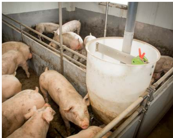
Tot het afleveren krijgen de varkens onbeperkt droogvoer.