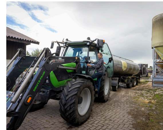
Een van de zelfkazers brengt zijn vrachtje wei bij Spruit.

Mattieu Spruit in Oudewater houdt varkens om zijn rundveetak meer circulair te maken