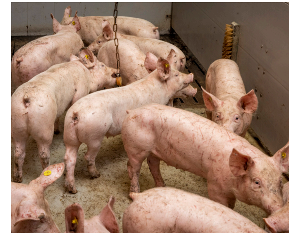
Pas opgelegde vleesbiggen krijgen nog geen kaaswei.