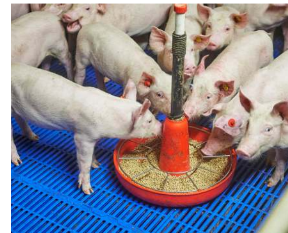
Tot opleg in vleesvarkensstal krijgen de biggen droogvoer.